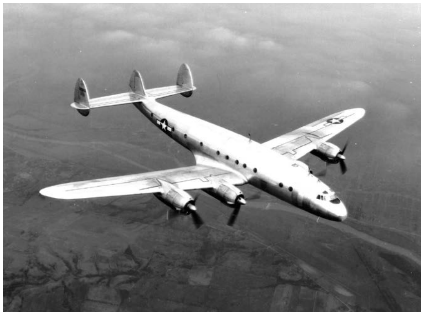
Lockheed Constellation C-69