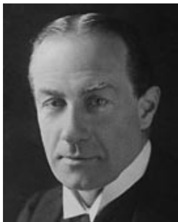
Стэнли Болдуин, премьер-министр. 1935 г.

Болдуин, «...добрый старый викарий, снисходительный и терпеливый, которого невозможно рассердить...» — такой образ он усердно формировал среди коллег и публики — не остался в долгу и поделился с окружающими следующим