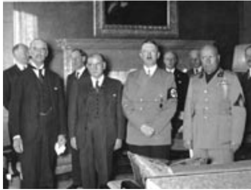
Слева направо: Чемберлен, Даладье, Гитлер и Муссолини в Мюнхене 28 сентября 1938 г.

«Конечно же, нет» — сказал Гитлер — «я всегда стараюсь сделать все для того, чтобы гражданские лица не пострадали». И добавил, что ему «...ненавистна сама мысль о том, что невинные дети могут оказаться убитыми газовыми бомбами...».