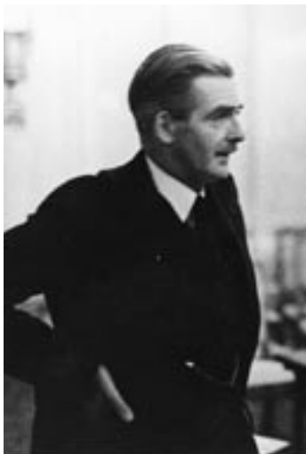
Э. Иден, министр иностранных дел Великобритании

«...В своем отношении к наиболее важным вопросам британской внешней политики, как и в отношении к недавно возникшим авторитарным государствам, Чемберлен руководствовался твердыми и честными идеалами. Он при-