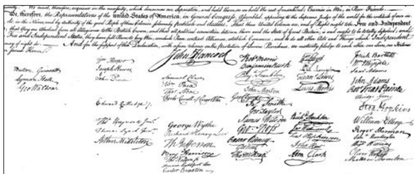
Подписи «отцов-основателей» под Декларацией о независимости.

«Патриоты по инерции твердили, что «дух 1776-го» вызвал к жизни новую нацию» — и этого было достаточно. Наступило странное время безвластия и, одновременно, многовластия. Отдельные штаты, и до того с большим подозрением относящиеся к соседям, все более агрессивно начали проводить независимую, обычно дискриминационную торговую политику. Никто не знал, что делать с огромными долгами как отдельных штатов, так и взятых от имени Континентального конгресса Конфедерации американских штатов (именно так, строчными буквами). Резко падающий доллар стал причиной быстро растущей инфляции, что привело к возникновению невиданной до того спекуляции. Дошло до того, что отдельные штаты не только проводили независимую внутреннюю политику, но пытались делать то же самое в отношении внешней политики и обороны. Например, стали создавать свой военный флот. Страна быстро погружалась в хаос, за которым внимательно наблюдали достаточно серьезные английские военные силы в районе Великих озер, которые — естественно, с подачи Парламента — «забыли» выполнить условия мирного договора и покинуть территорию Америки.