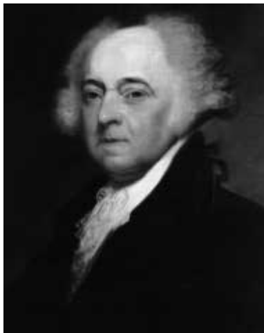
Джон Адамс, 2-й президент США

Я настаиваю, что евреи сделали для цивилизации человека больше, чем любая другая нация.