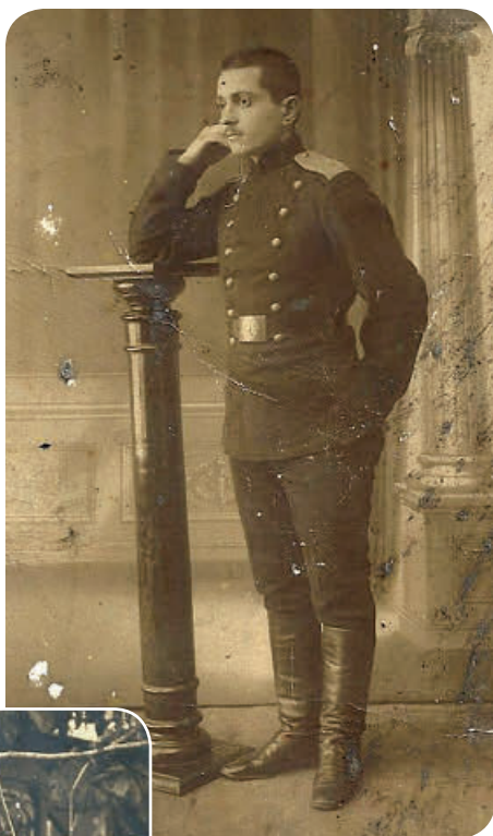
Нухим Вайсман на военной службе. г. Остров, 9 декабря 1912 г.