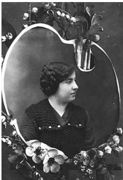
Буза Красноштейн.

Как и все юные барышни того времени, бабушка имела альбом, где хранила открытки и фотографии поклонников с персональными посвящениями. До нас дошли только три