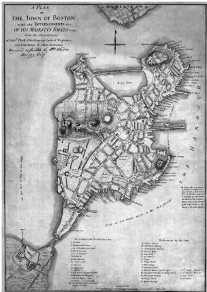
Карта Бостона 1775 г.