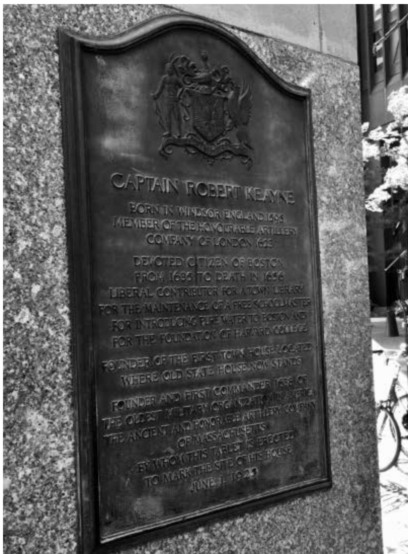
Мемориальная доска в память Р. Кейна

вестная революционная ситуация, когда верхи уже не могли управлять по-старому, а низы совершенно не желали жить как прежде.