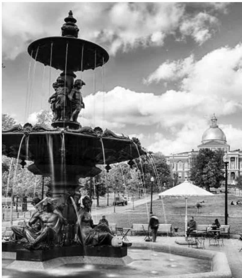
Парк Бостон Коммон