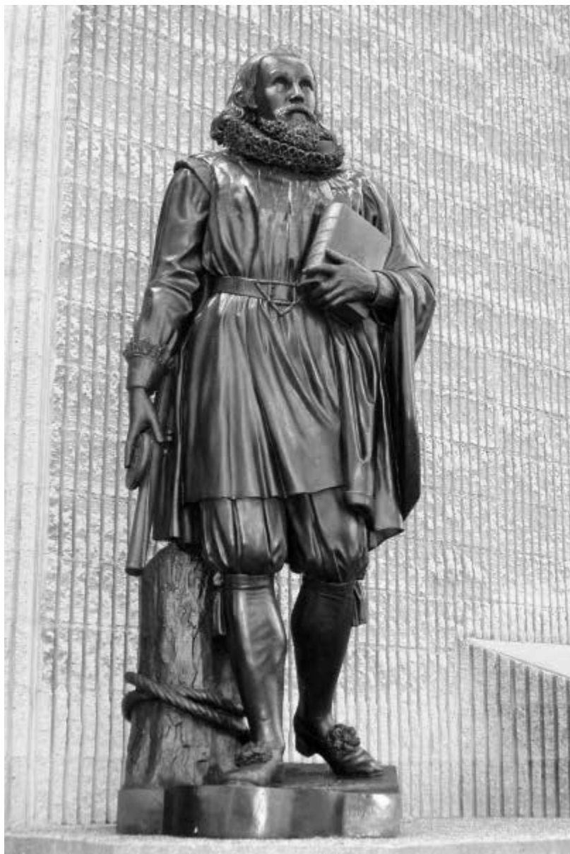
Памятник первому губернатору Массачусетса Дж. Уинтропу