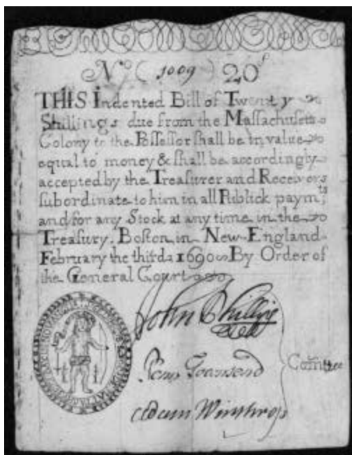
Банкнота колонии Массачусетс

вищ». Легенда подогревалась тем, что бостонский капитан, по его собственному мнению, нашел лишь кормовую часть разбитого штормом галеона. Несмотря на многочисленные заманчивые предложения, Фипс сохранил в тайне координаты рифа, где покоились сокровища (во время экспедиции он единолично прокладывал курс судна).