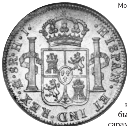
Монета в восемь реалов

19 апреля 1687 года наблюдатель с мачты закричал, что видит на горизонте корабль. Капитан Фипс опознал французский корвет «Глуар», известный своими разбойничьими рейдами. Имея солидное вооружение, «Джеймс энд Мэри» мог бы дать достойный отпор корсарам, но капитан предпочел не рисковать добытыми сокровищами.