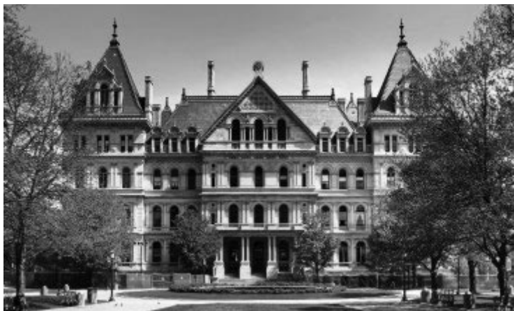
Здание законодательной ассамблеи в Олбани

ломбардов из Бруклина и продавцы виски из Буффало, коммерсанты из Саратоги и газетчики из Рочестера, мясники из Сиракуз и механики из Скенектади. Последний из городов, к слову, был отмечен русской литературой, с не меньшей иронией выведенный Ильфом и Петровым в «Одноэтажной Америке».