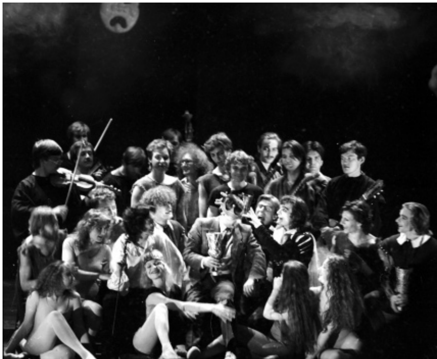
Труппа театра «Арлекин». Москва, 1990 год.