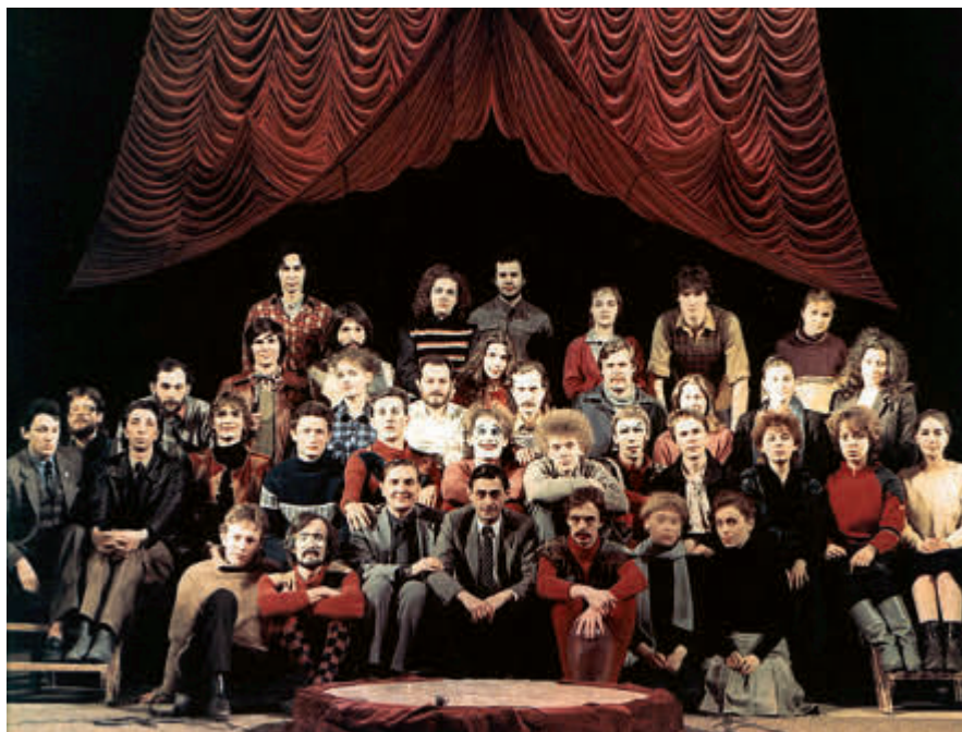
Московский музыкально-драматический театр «Арлекин», 1989 г.